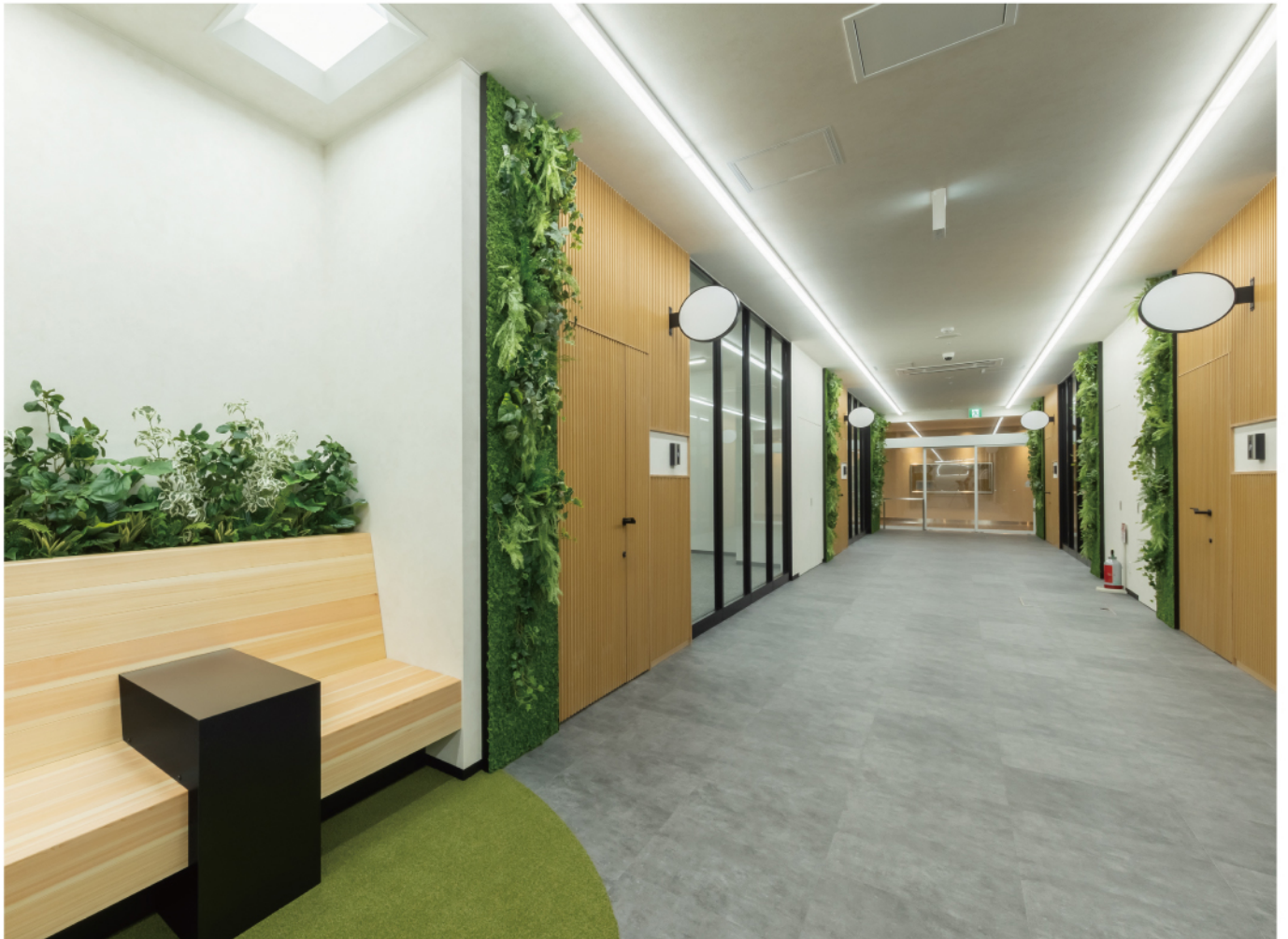
※弊社は主に屋内向けフェイクグリーンを取り扱っており、室内空間を中心に対応しています。ご希望に合わせて、屋外部分は協力会社が対応することも可能です。