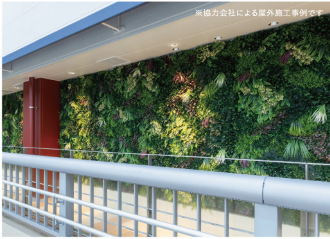
※協力会社による屋外施工事例です