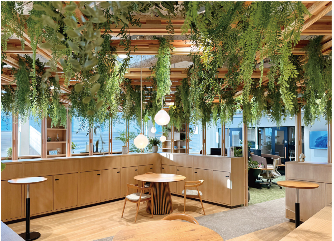
オフィス商談スペース・執務室 ハンギンググリーン装飾