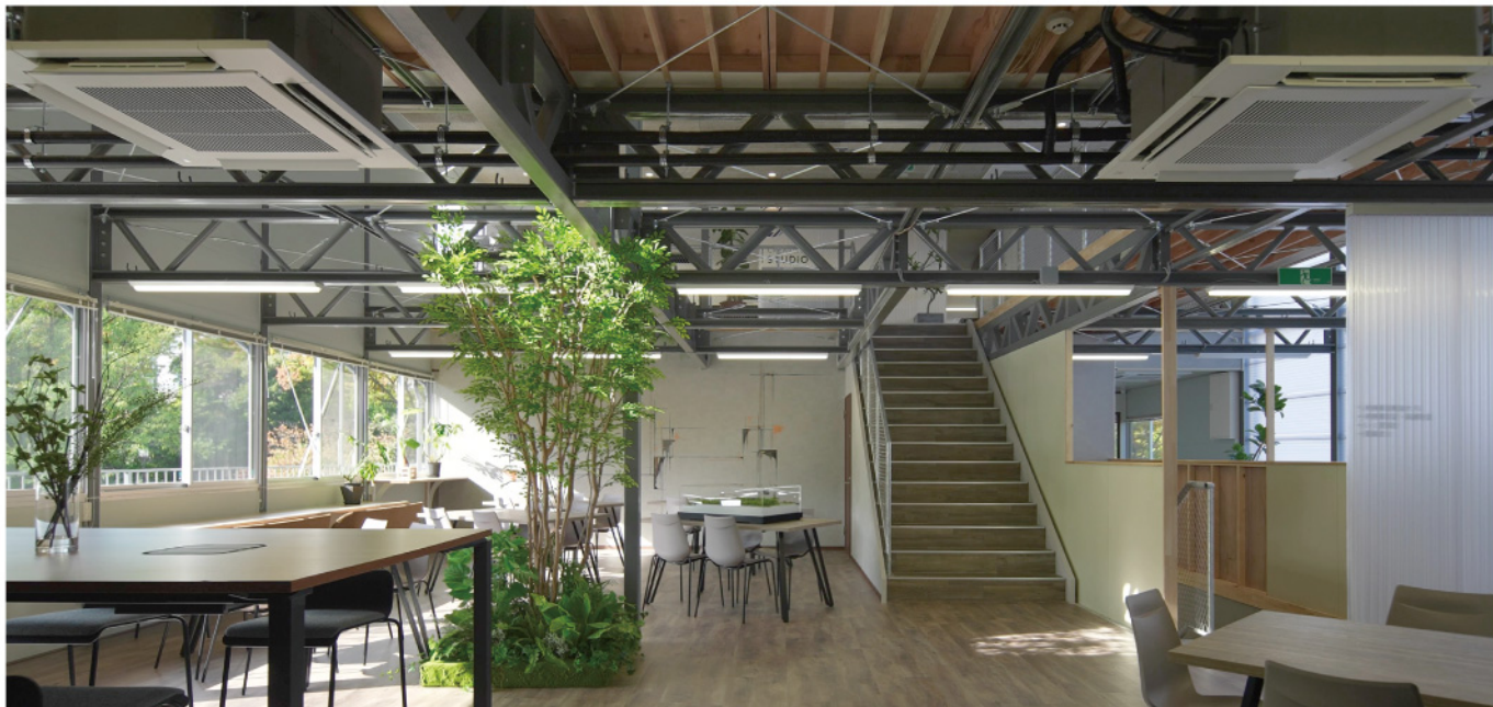
現場事務所休憩スペース直置き植栽