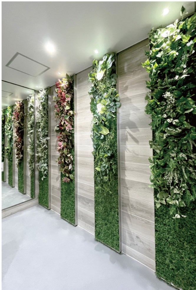
サステイナブル素材を使用 スタジアム トイレスペース