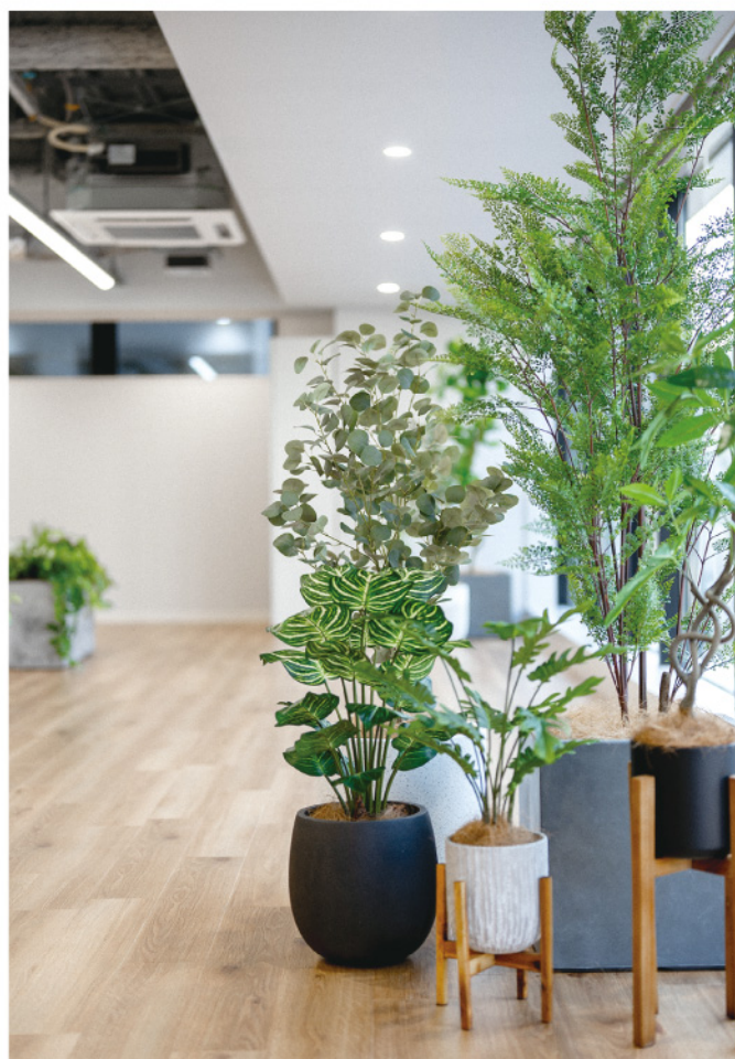
オフィス ディスプレイグリーン