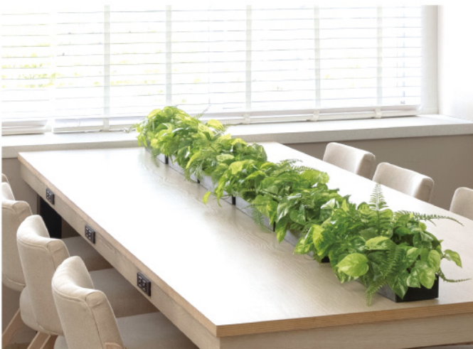
シェアオフィス テーブルパーテーション