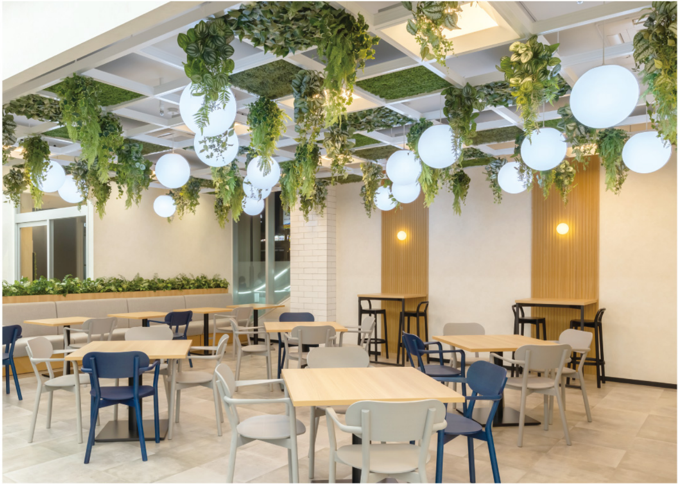
駅前商業施設 休憩スペース ハンギンググリーン・パーテーション