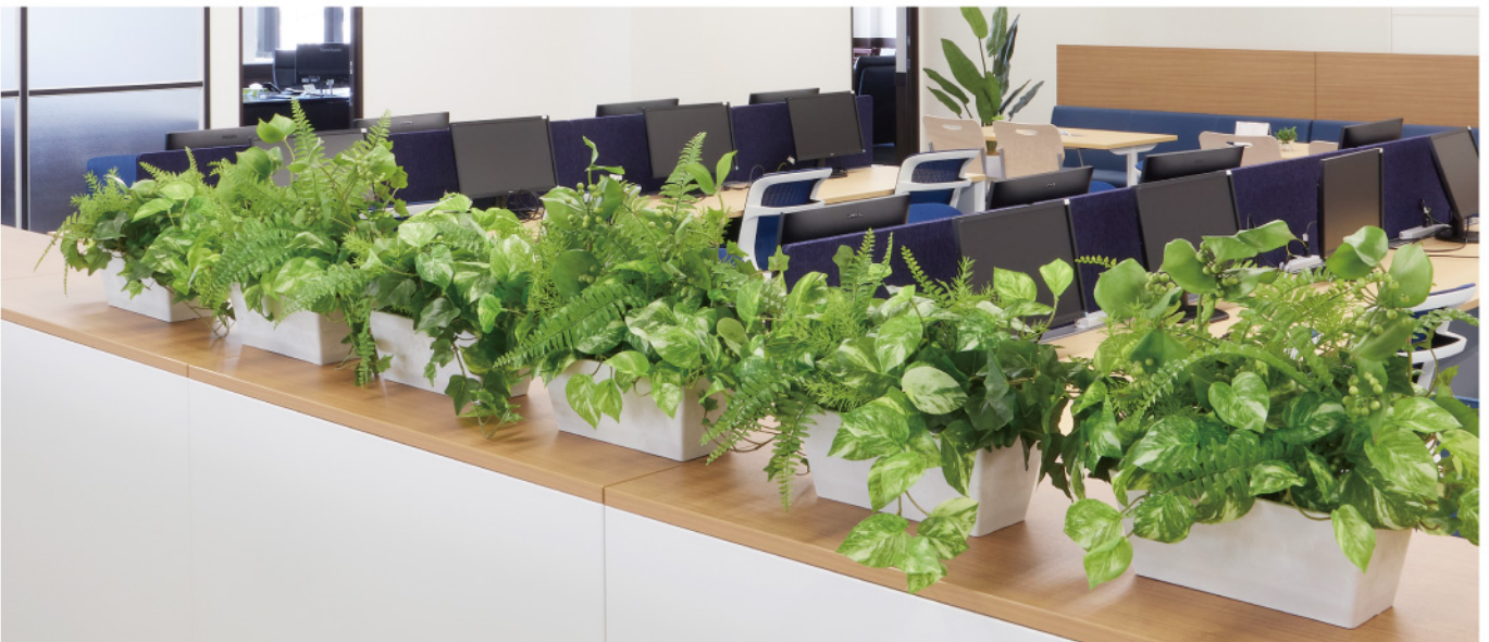
オフィス カウンターパーテーション