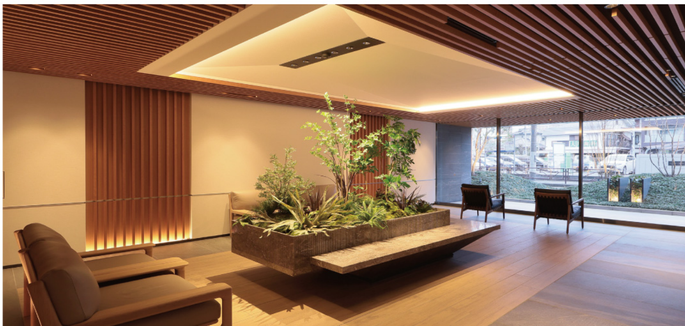
マンション エントランス 植栽