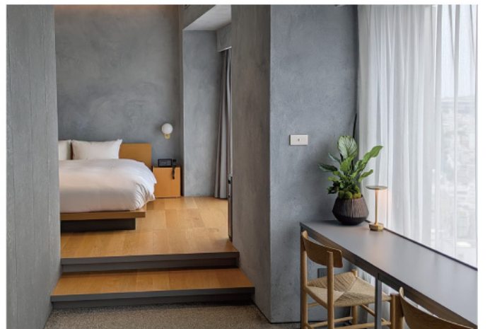
ホテル スイートルーム 特注グリーンアレンジメント