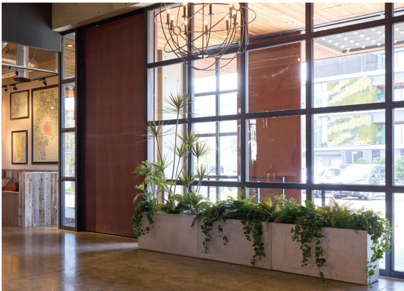
ホテル エントランスグリーン