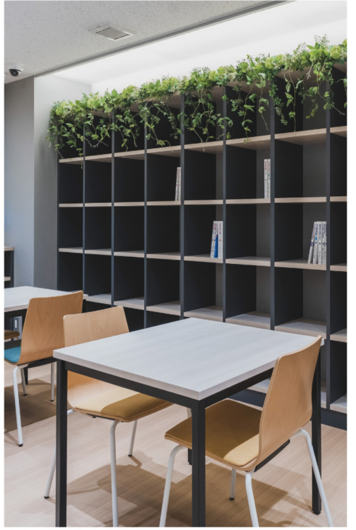
専門学校 カフェ・自習スペース 棚上グリーン