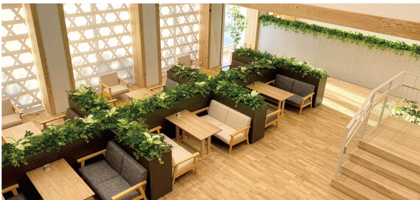
オフィス エントランスホール プランター植栽