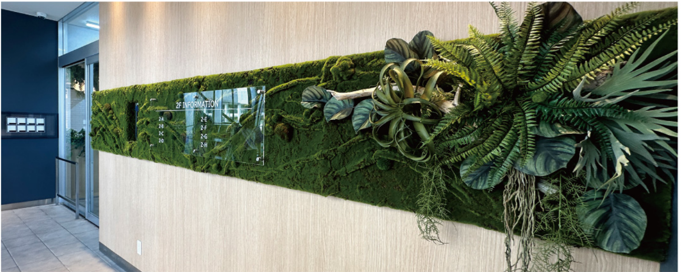
駅前商業施設 エントランス 苔の壁面緑化