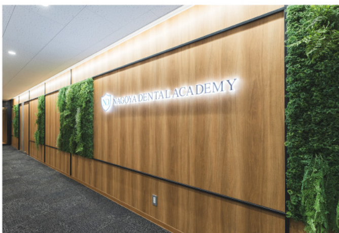
専門学校 エントランスにロゴサインと壁面パネル装飾