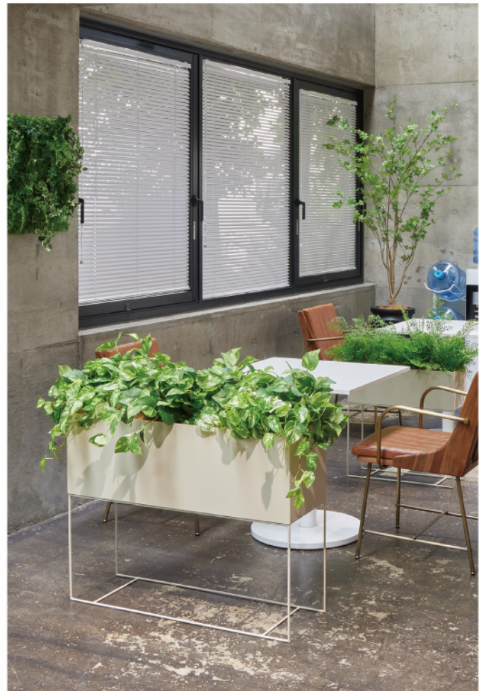
シェアオフィス パーテーショングリーン