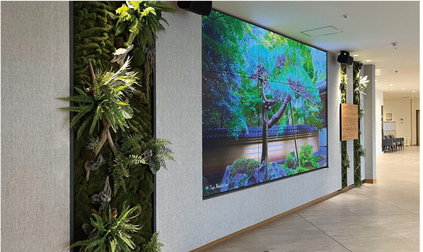
メディカルセンター エントランス 苔の壁面緑化