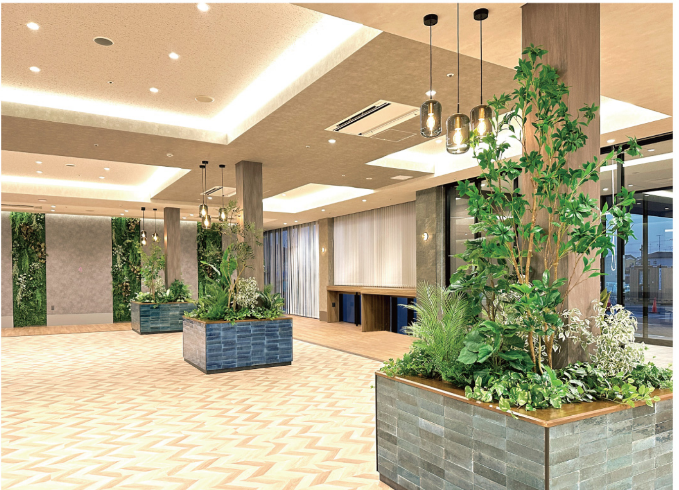
クリニックエントランス 待合スペース 壁面緑化・花壇植栽