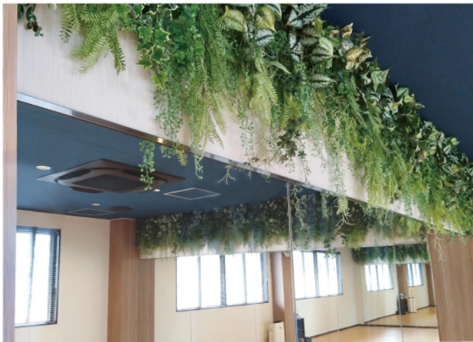
ヨガスタジオ 壁面装飾