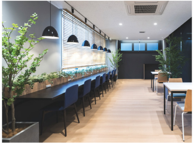
専門学校 カフェ・自習スペース