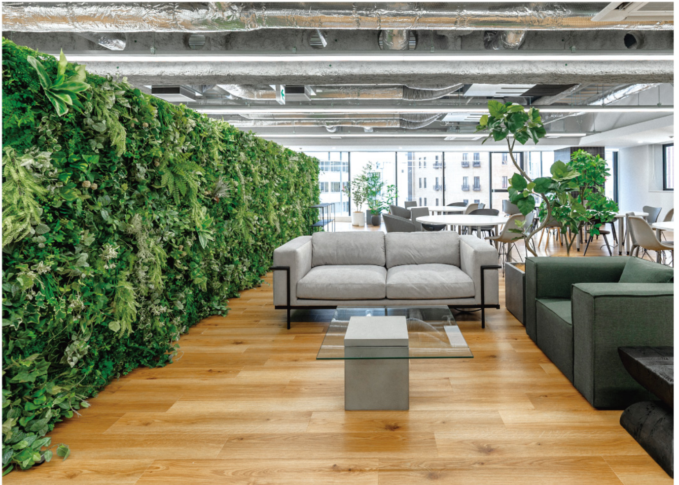
ワンフロアのオフィスの空間 可動式のグリーンパネルのパーテーション