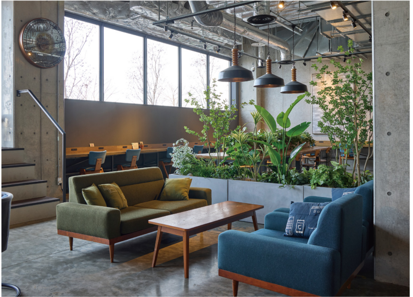
ホテル内 ワンフロアのフリースペース