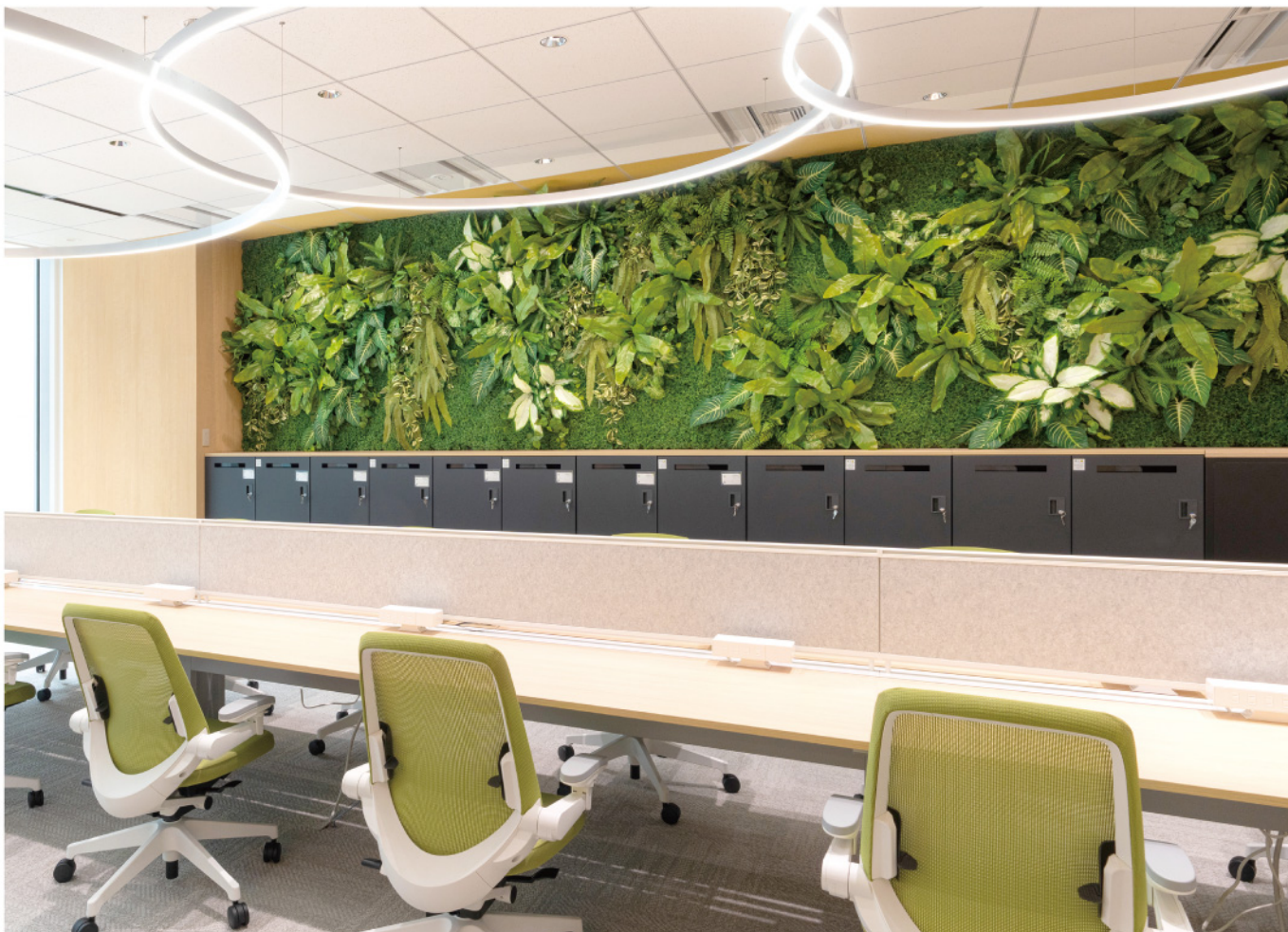
オフィス内緑化 パーソナルロッカー上部 壁面装飾