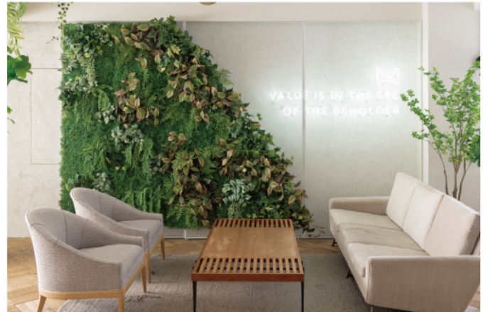
シェアオフィス内休憩スペース