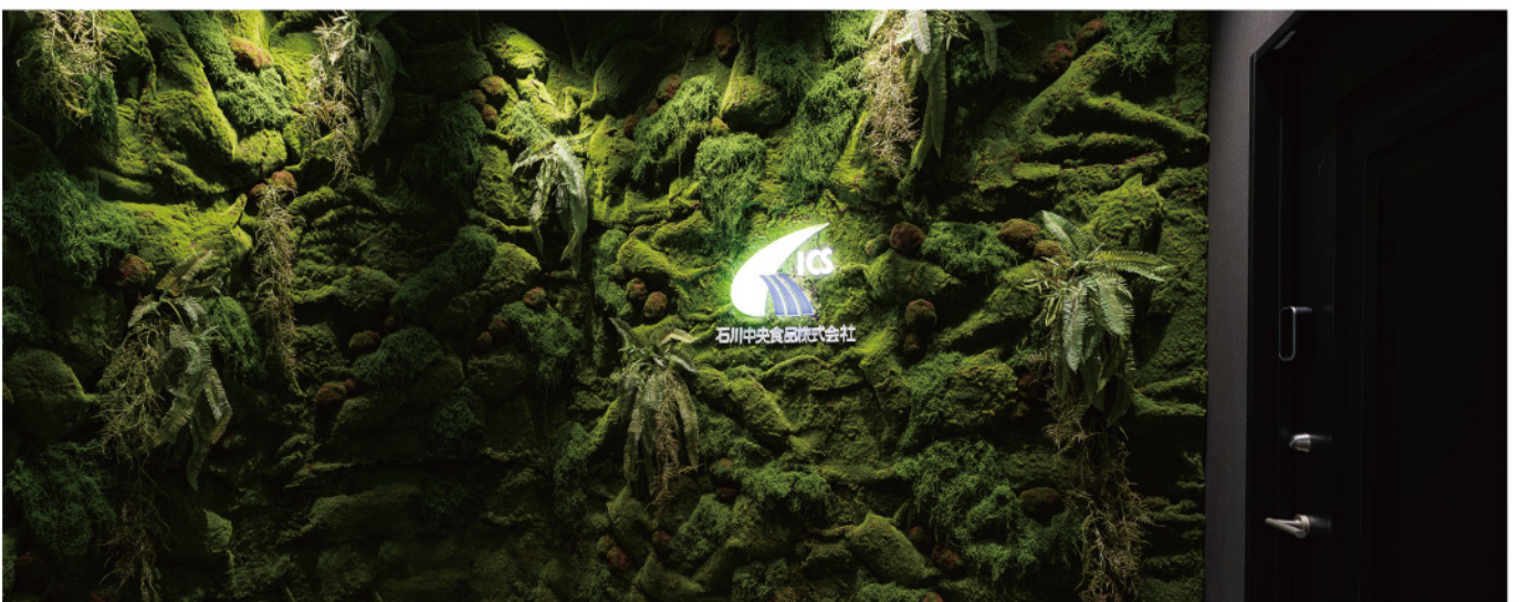
オフィスエントランス ログサインと苔の壁面緑化