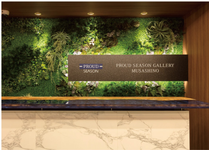
マンションのモデルルーム 間接照明を効かせた壁面グリーン