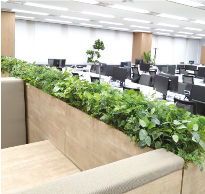
オフィス パーテーショングリーン